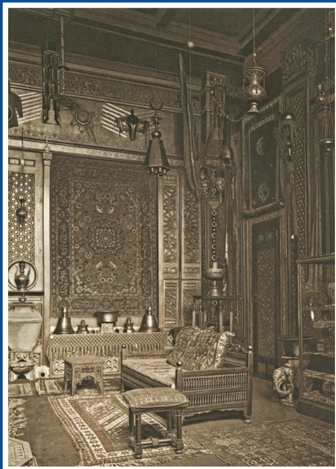
Salon oriental d'Albert Goupil, rue Chaptal à Paris

Tarifs / jour : Colloque seul* : 5€/gratuit Exposition + colloque* : 13 €/9€/5€/gratuit